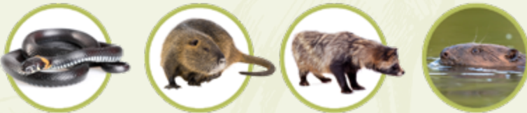
Ringslang Muskusrat Wasbeerhond Bever